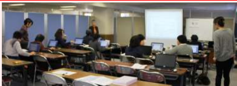
＜無料パソコン講座＞ 福島県から避難された方々が参加。 右:最終日に講師たちと昼食会を行ないました。