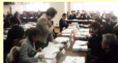
初めて女性が入った 大田区防災会議

特別職報酬審議会委員、おおた健康プラン推進会議委員、大田区男女平等推進区民会議委員、子育て応援サイト編集委員会委員長・委員、大田地域包括支援センター運営協議会委員、おおたユニバーサルデザインまちづくりパートナー、公益財団法人大田区体育協会評議員