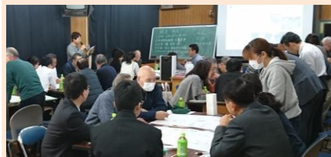
大森二中での防災講座