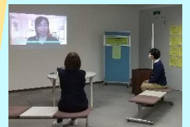
「きっかけはエセナおおた」のみなさまのインタビュー動画を上映しています。